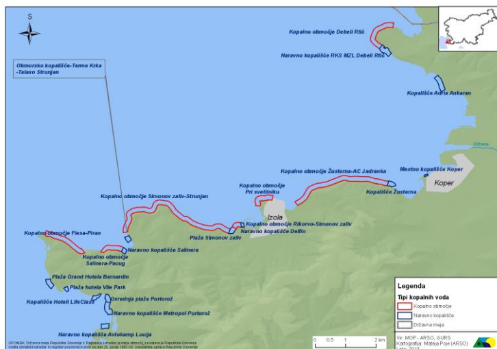
Slika 2: Kopalne vode na morju v letu 2015.

Analize kopalne vode so potekale v času kopalne sezone (od 1.6. do 15.9.2015). Na terenu so se izvedle terenske meritve in ocene prisotnosti vidnih nečistoč, mineralnih olj, fenolov in detergentov, v laboratoriju pa v posameznem vzorcu vode analize na prisotnost Escherichia coli in intestinalnih enterokokov.